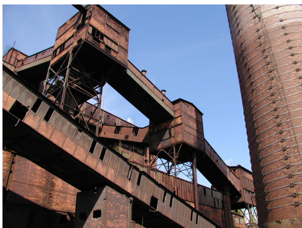
přesýpací stanice PS II a PS III nad spékárnou s mosty B5 a B51