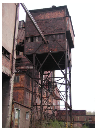
přesýpací stanice PS I