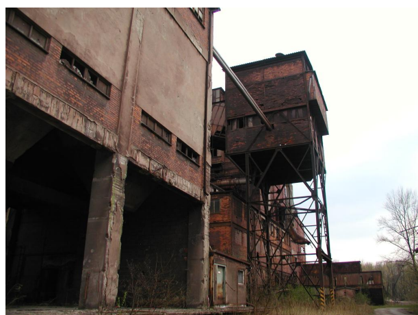
přesýpací stanice PS I