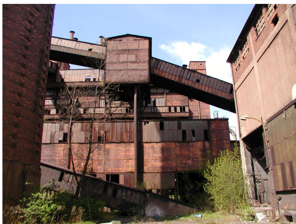
mosty B5 a B51