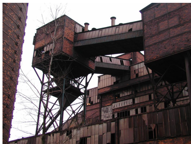
přesýpací stanice PS III nad spékárnou s mosty B51 a B71