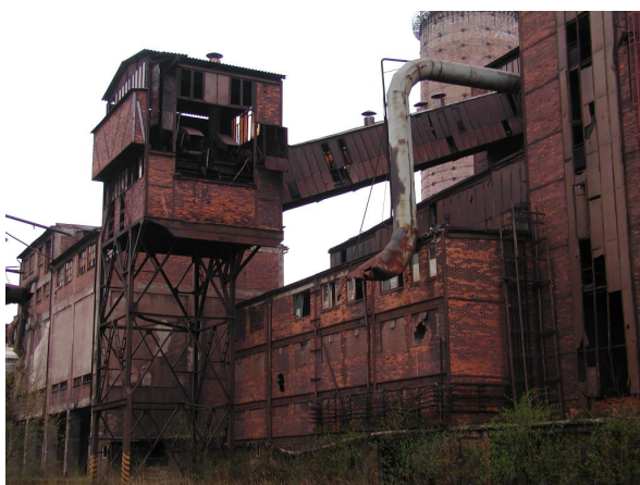
přesýpací stanice PS I