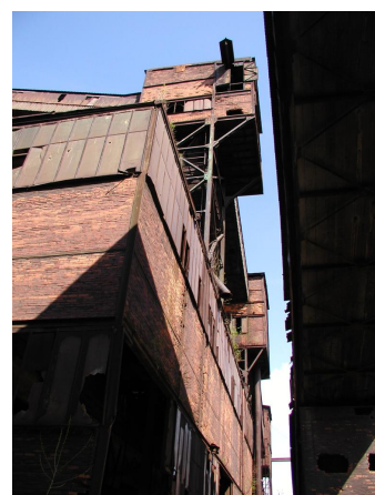
přesýpací stanice nad spékárnou