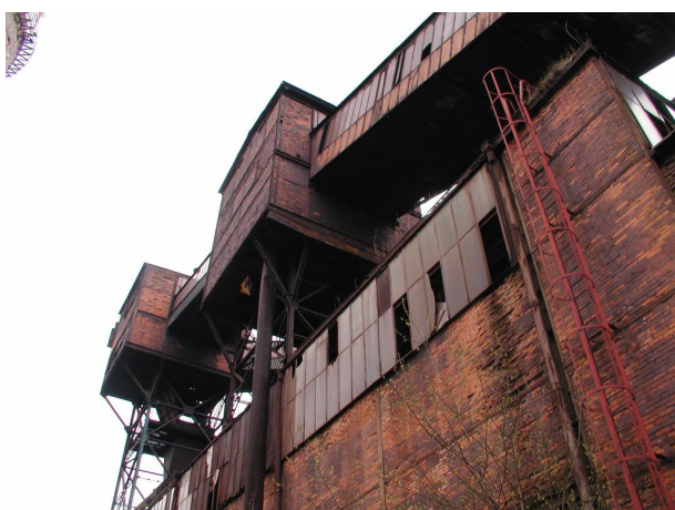
přesýpací stanice PS II a PS III nad spékárnou s mosty B5 a B51